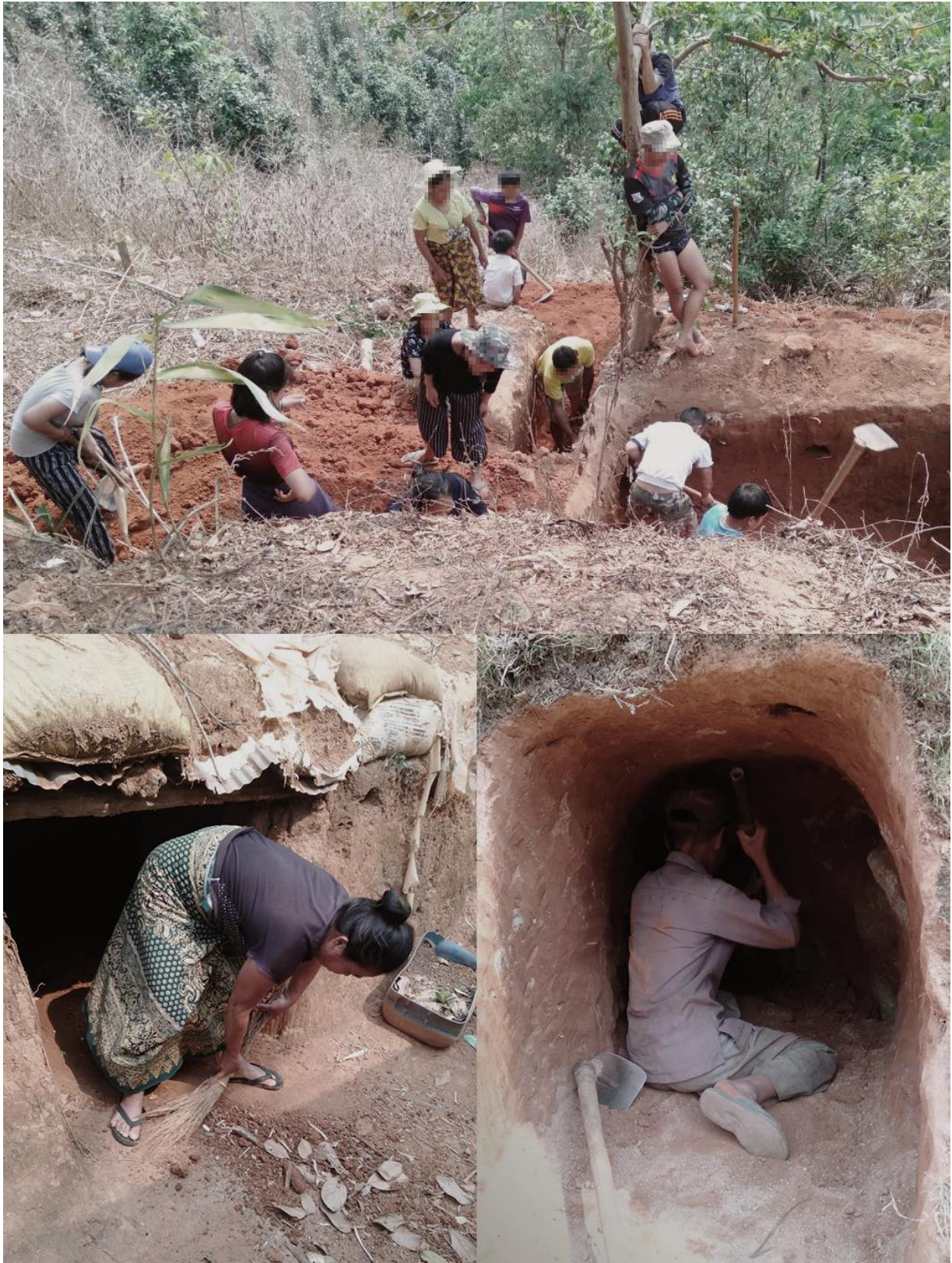
เมื่อวันที่ 1 เมษายน 2564 ผู้ผลิตถ่านภายในประเทศกำลังเตรียมที่หลบภัยเพิ่มเติมหากกองทัพทหารพม่าโจมตี